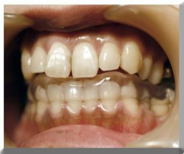
K 3 Wスプリント